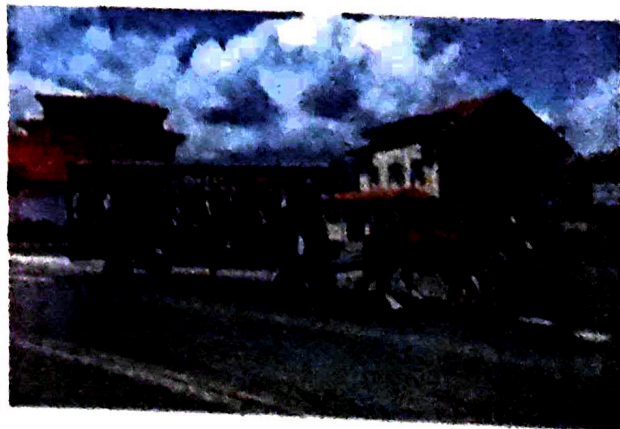
Promenade en attelage